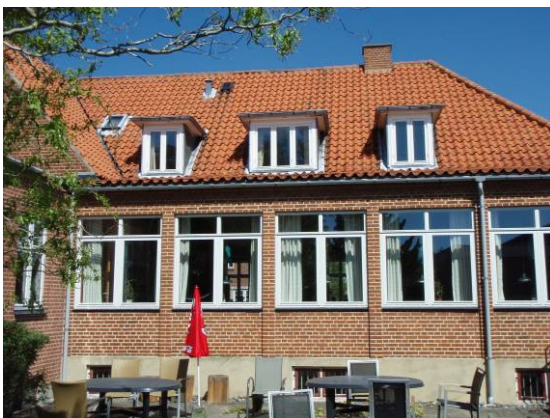
Hjemmet set fra syd – med tilbygningen fra 1954 i forgrunden. Vinduer er udskiftet i 2003.