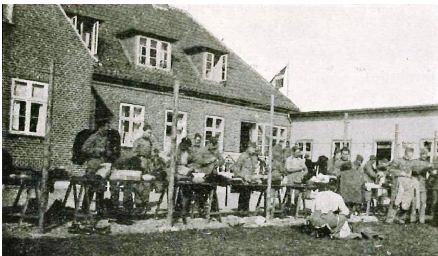
Soldaterne ordner tøj (1935)

Hjemmet fejrer således sit 75 års jubilæum i 2009.