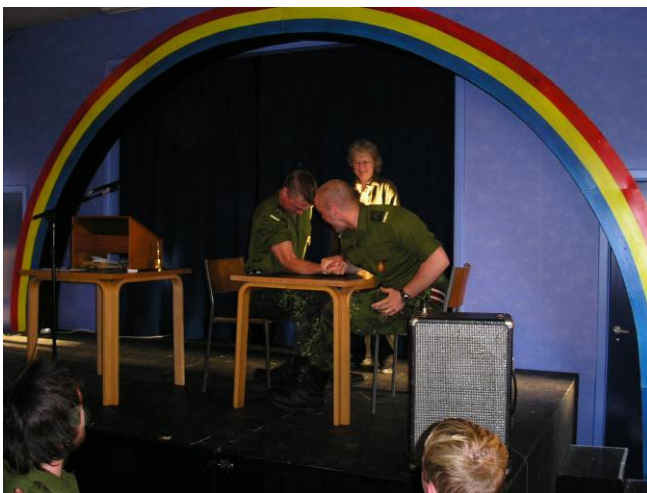
Festsalens scene i brug ved de traditionsrige velkomstfester for nye værnepligtige (2004)