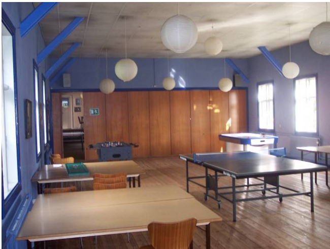
Festsalen indvendigt (2008)